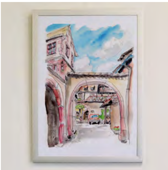
Motiv T 5

Alle Prints 49,- ermäßigt 29,-* * für Studie- rende