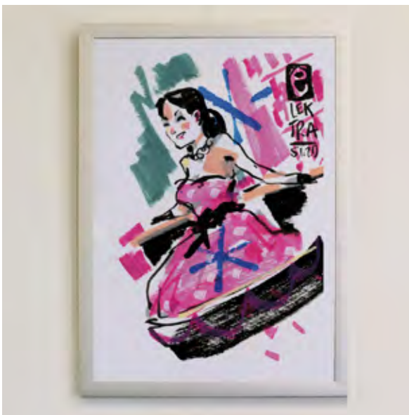
Motiv T 9

Alle Prints 49,- ermäßigt 29,-* * für Studierende