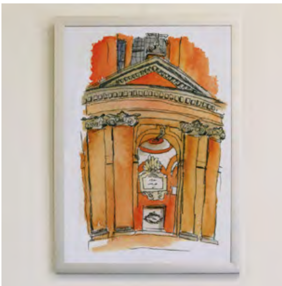
Motiv T 1

Alle Prints 49,- ermäßigt 29,-* * für Studierende