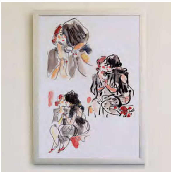
Motiv T 13

Alle Prints 49,- ermäßigt 29,-* * für Studie- rende