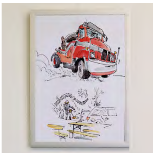
Motiv T 19

Alle Prints 49,- ermäßigt 29,-* * für Studierende