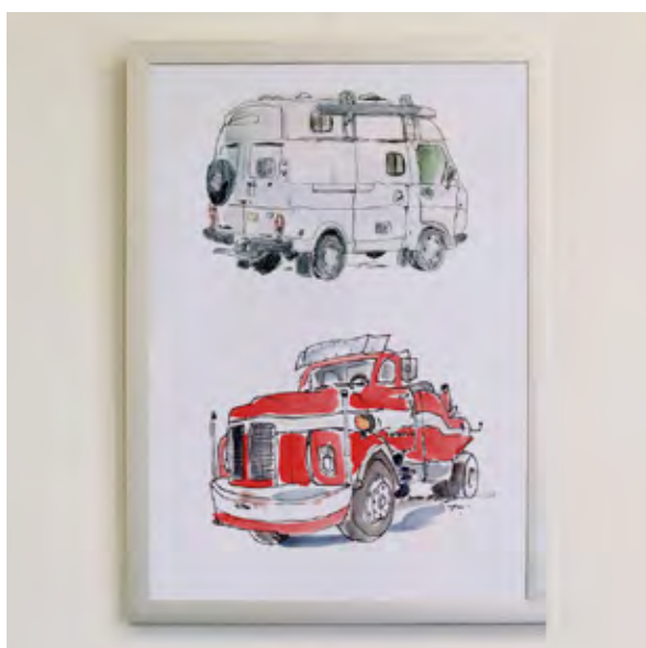
Motiv T 15

Alle Prints 49,- ermäßigt 29,-* * für Studierende